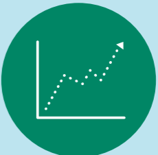
Dib u eegis